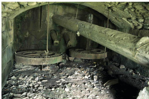
Olea errota, 1988

Nonbait ez zuen sortzen behar hainbat indar, eta 1927an Lazkaotik zutikako posteak jarri zituzten argindar gehiago ekartzeko. Lan-tegiek ere pairatu zituzten argindarra sortzeko arazoen ondorioak 36ko gerra amaitu zenean. Hala, generadoreak mugitu eta argindarra sortuko bazuten, besteren artean,