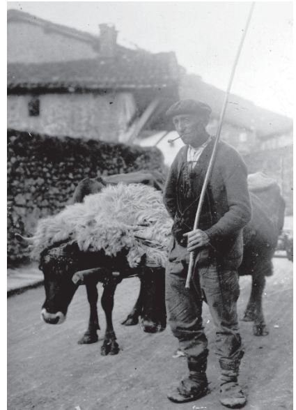
Arrondo auzoa, 1915

Ataungo basoetatik ateratako egurra ez zuten eraikuntza lanetarako bakarrik erabiltzen. Sukaldeetarako nahiz karobietarako su-egurra ere bertako zuhaitzen egurrekin egiten zen. Hala berean, mendiko txondorretatik ateratzen zuten gerora labe zein sutegietan erabiliko zen egur-ikatza. Horrez gain, oholak, taulak eta arraunak ere egiten zituzten. 1754ko uztailean, esaterako, herriko itzain batek tratua egin zuen Anoetako merkatari batekin Ataungo basoetan egindako arraunak abendurako Anoetara eramateko. Donostiako merkatari batek, berriz, hiru urte geroago, 1757an, honako tratua egin zuen gure herriko beste itzain batekin: 200 orga arraun, Mantirano mendian prestatzen ari zirenak, Anoetara garraiatu behar zituen, eta, gurdikada bakoitzeko,