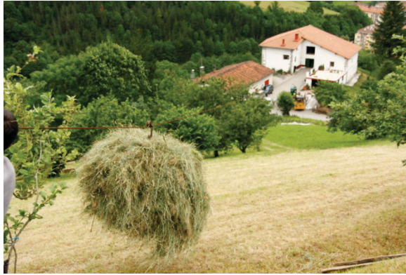
Agerre Handi baserria, 2012

datik aurrez prestatuta egoten ziren janariak eta ardoa hartu eta kablera inguratzea gora bidaltzeko, eta horien antzeko lanak. Eguneroko hiru otorduetan, baba beltza egosita eta taloak jaten genituen. Kuadrilla handia aritzen zen lanean, baita ataundarrak ere. (Ezezaguna)