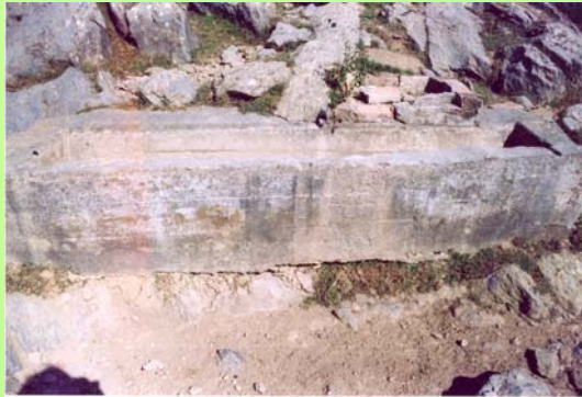
Iturria 2005eko uda/negua