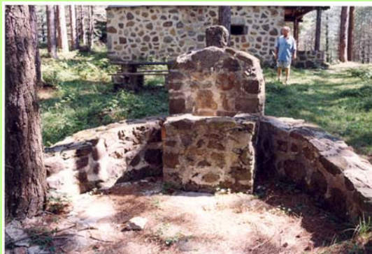
Iturria 2005eko uda/negua