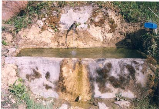
Iturria 2005eko uda/negua