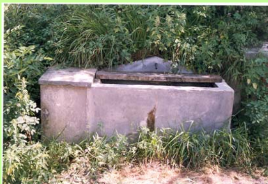
Iturria (Suki baserriaren aurrekoa) 2005eko uda/negua