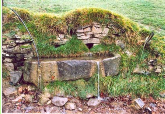
Iturria 2005eko uda/negua