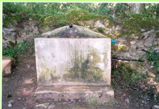
Iturria 2005eko uda/negua