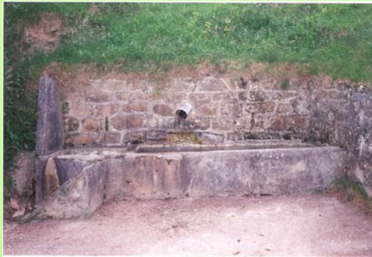
Iturria 2005eko uda/negua