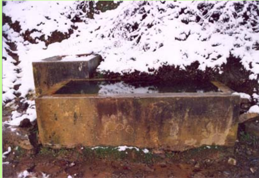
Iturria 2005eko uda/negua