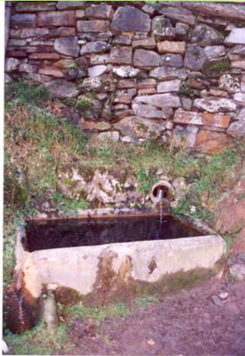
Iturria 2005eko uda/negua